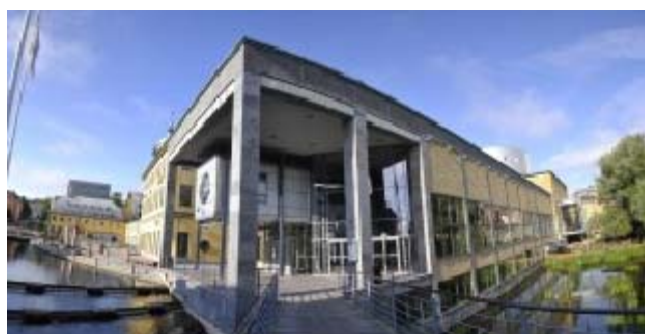
Entrén vid Louis de Geer konsert & kongress

Det finns många aktiviteter, som besökarna kan ägna sig åt. Att vandra genom den stora utställningshallen