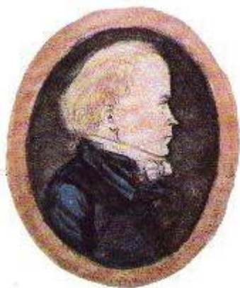
Erik Johan Stagnelius prästson från Öland