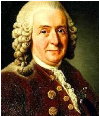
Carl von Linné prästson från Småland

Med reformationen rev Gustav Wasa sönder den katolska kulturen i vårt land. Genom att låta de lutherska prästerna gifta sig, skapades förutsättningar för något nytt. I de ofta barnrika prästhemmen fostrades den nya tidens kulturelit med stor betydelse för landets utveckling.