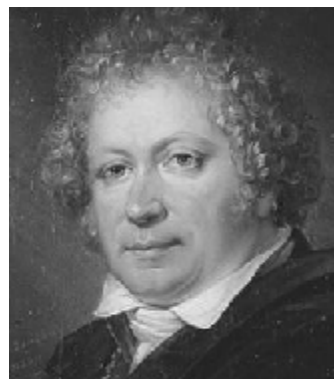
Esaias Tegnér prästson från Värmland