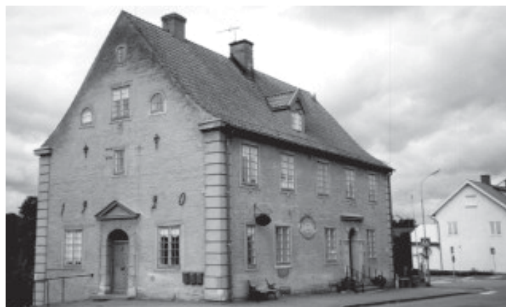
Garboutställningen, Storgatan 26, Högsby

Mycket beröm av utställ- ningen har genom åren be- styrkts i våra gästböcker.