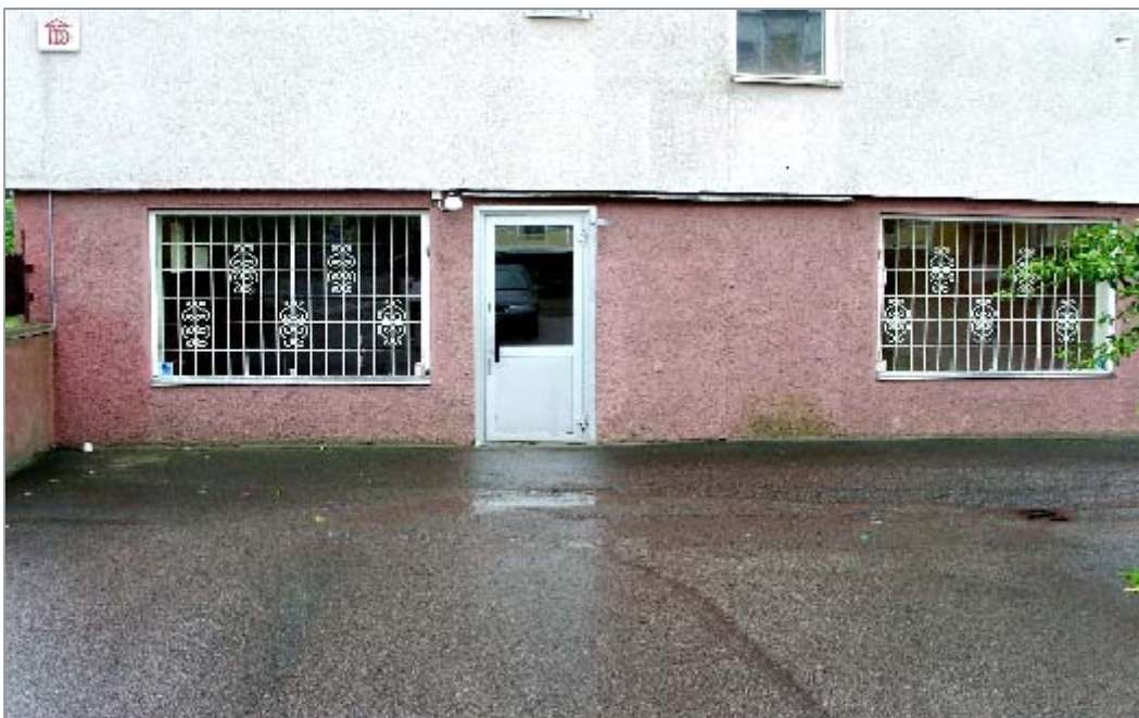
PLF:s nya lokaler på Stengatan 16 A. Ingång Kyrkogårdsgatan

Det är ingen tillfällighet att vi valt just den platsen. Där befinner vi oss nämligen på historisk mark. Den gamla byggnaden är den första fasta skolbyggnaden i Fliseryds socken. Här finns också Grönskogs gård med en mycket intressant historia. Vill du veta mer om detta kan du läsa på sidan 5. Vi hoppas kunna besöka herresätet och få ytterligare information av ägaren själv.