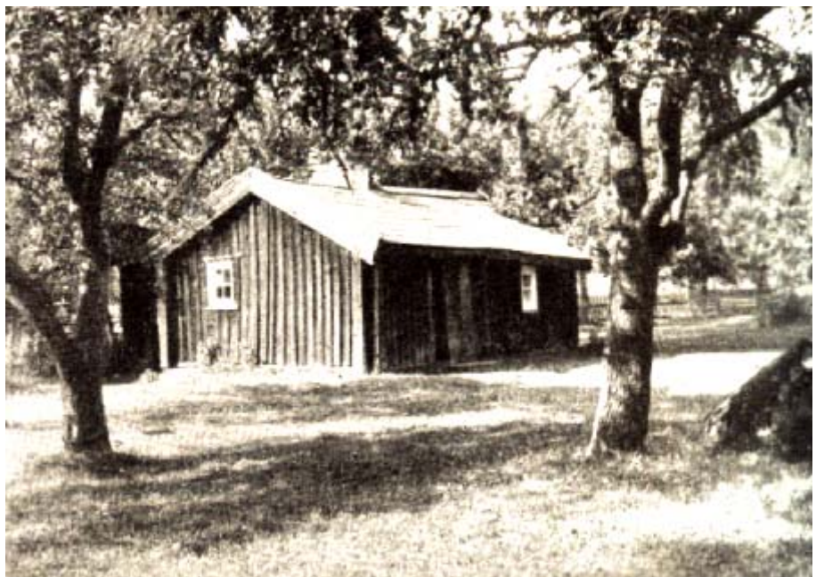
Båtsmanstorp från Skinnaremåla i Ålems socken

Det var inte helt ovanligt att hon också tvingades utföra vissa tjänster som inte beordrats av husmodern. Både husbonden och vuxna söner kunde