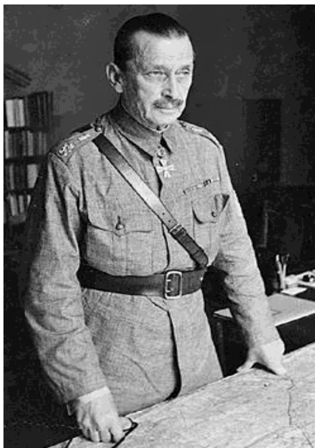
Alla tiders främste Sursill Marskalk Gustaf Mannerheim