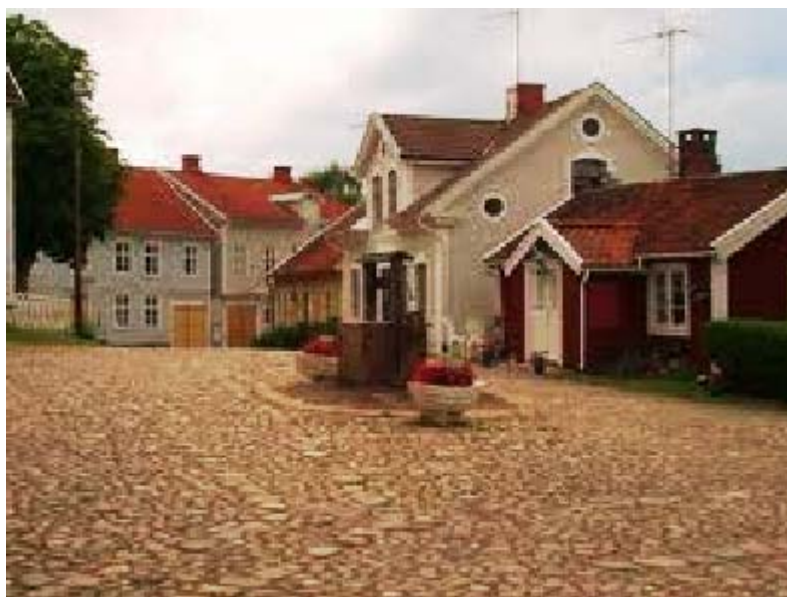
Torget med kullersten och brunn. En ovanligt välbevarad 1800-talsmiljö.

Sjöfarten och skeppsbyggeriet kulminerade under 1800-talet och fram till omkring 1920. Många av fartygen hade Pataholm som hemmahamn. Här fanns personer, vilka fungerade som handlare, varvsägare och redare på samma gång, och 1863 fanns inte mindre än 16 fartyg registrerade, vilka alla tillhörde personer i köpingen. De pataholmsfartyg som låtit mest tala om sig är Briggen Gerda och Förlig Vind. När ångbåtsepoken