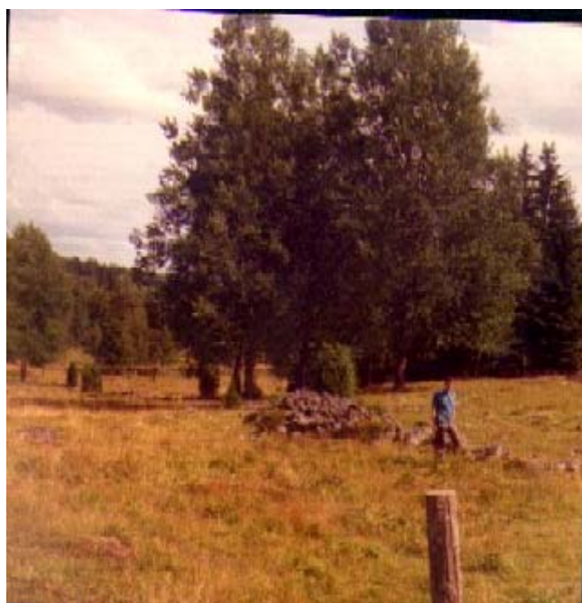
1970 besökte författaren resterna av stugan